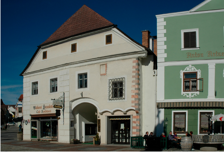
Abbildung 1: Das Gebäude am Dreifaltigkeitsplatz 4 beheimatet heute die Bäckerei-Konditorei Hausleitner, Aufnahme von 2010, Stadtarchiv Zwettl, Foto: Werner Fröhlich.

Für die Publikation der Stadtgeschichte Ende der 1970er Jahre wurde u. a. eine Hausbesitzerreihe der Stadt Zwettl angefertigt. 71 Diese Reihe enthält nicht viel mehr als Jahreszahlen, Namen und, wenn bekannt, die Art der Übertragung als Zifferncode. Für den Dreifaltigkeitsplatz 4 sieht die Reihe folgendermaßen aus: