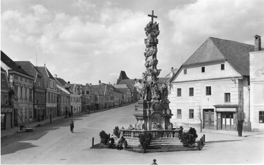
Abbildung 2: Dreifaltigkeitsplatz 4, vor 1938. Der Zustand des Hauses entspricht dem auf anderen Abbildungen von ca. 1900. Das Verkaufslokal ist noch auf der rechten Seite angesiedelt und die Toreinfahrt verschlossen