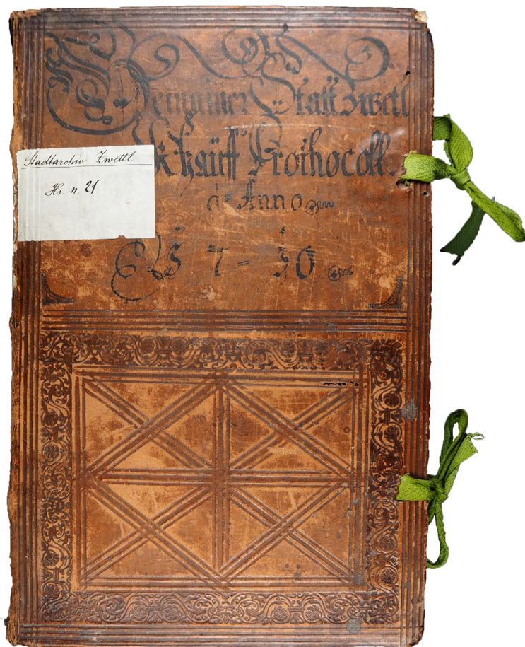
Abbildung 3: Protokollbücher sind eine sehr wertvolle Quelle, denn sie enthalten – entweder nach Materien getrennt, wie hier im Fall des Kaufprotokolls, oder auch in einem Band versammelt – unterschiedliche Arten von Verträgen: Kauf-, Heirats- und Übergabsverträge, aber auch Testamente und Inventare. Sie geben damit Einblicke in Besitz- und Vermögensverhältnisse sowie in Transaktionen und damit zugleich in Regelungsbedarf und in soziale Beziehungen. Einband des Hauskaufprotokolls 1710–1727, Stadtarchiv Zwettl (StAZ), HS 6/5.