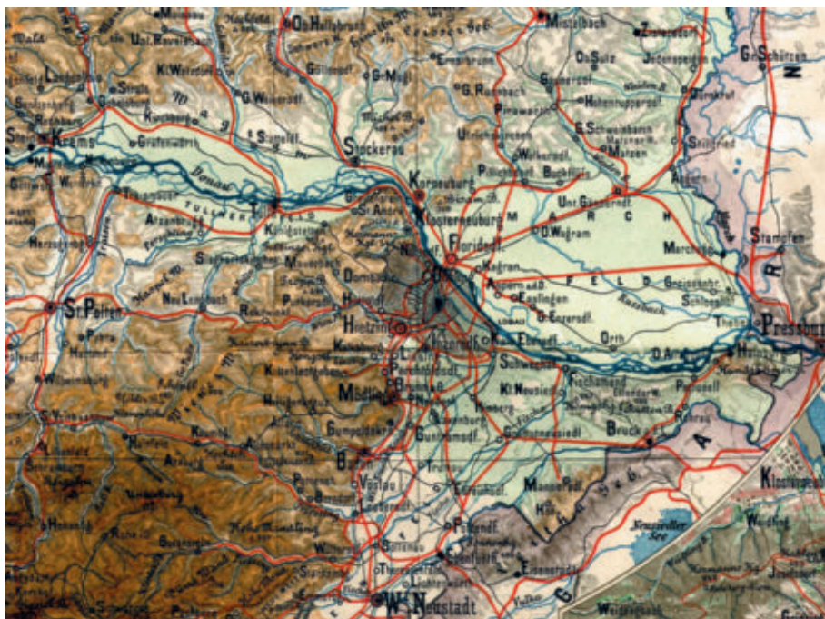
Abbildung 1: Karl SCHÖBER: „Handkarte des Erzherzogthumes Oesterreich unter der Enns“, um 1900, Wien (1:750.000, Ausschnitt).

andererseits die Motorisierung sowie der Ausbau der Verkehrswege eine Rolle. Stefan Schmitz spricht deswegen von „Revolutionen der Erreichbarkeit“. 3