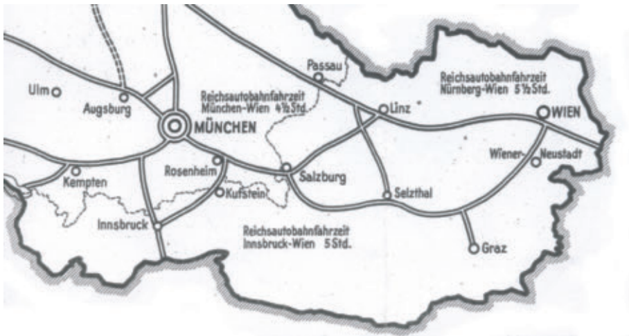
Abbildung 2: „Geplantes Netz der Reichsautobahnen in Österreich“, 1938, Rundschau deutscher Technik, aus: Wochenzeitung des Nationalsozialistischen Bunds Deutscher Techniker 14 (1938) 1.

mals eine der am stärksten befahrenen Straßen Österreichs und die Ausflugsgebiete von Rax und Semmering zogen genug Freizeitverkehr an, um aus den Mautgebühren den Bau der neuen Straße zu refinanzieren – ganz nach dem italienischen Vorbild. „Die gerade Linienführung“ gestatte „die Entfaltung der vollen Geschwindigkeit des Wagens, so dass die 65 km bis Gloggnitz leicht und mühelos in \frac{3}{4} Stunden und weniger zurückgelegt werden können“, so einer der beiden Ingenieure. 23 Offenbar entsprach also die „volle Geschwindigkeit eines Wagens“ damals ungefähr 90 km/h, für damalige Verhältnisse ein Höllentempo. 24 Das Projekt versandete jedoch in den Mühlen der Bürokratie, vermutlich auch, weil die Bundesregierung im gleichen Jahr ein großangelegtes Straßenbauprogramm ausarbeitete, das 1928 in Angriff genommen und nach einer Unterbrechung durch die Weltwirtschaftskrise bis 1936 vom Ständestaat weitgehend abgeschlossen wurde. „Mein Gott, was für eine Straße! Eine perfekte Gerade, 20 km lang. Der Wagen rast mit 60 km/h mühelos dahin...“, 25 berichtete ein französischer Autofahrer begeistert von der Fahrt auf der 1929 offensichtlich bereits bestens ausgebauten Straße vom Semmering nach Wiener Neustadt, wo ihm freilich in anachronistischer Weise an der Stadteinfahrt drei Schilling Mautgebühr abverlangt wurden. Dies ist eine der wenigen Quellen, die uns über damals übliche Fahrgeschwindigkeiten Auskunft geben, und zeigt, welche