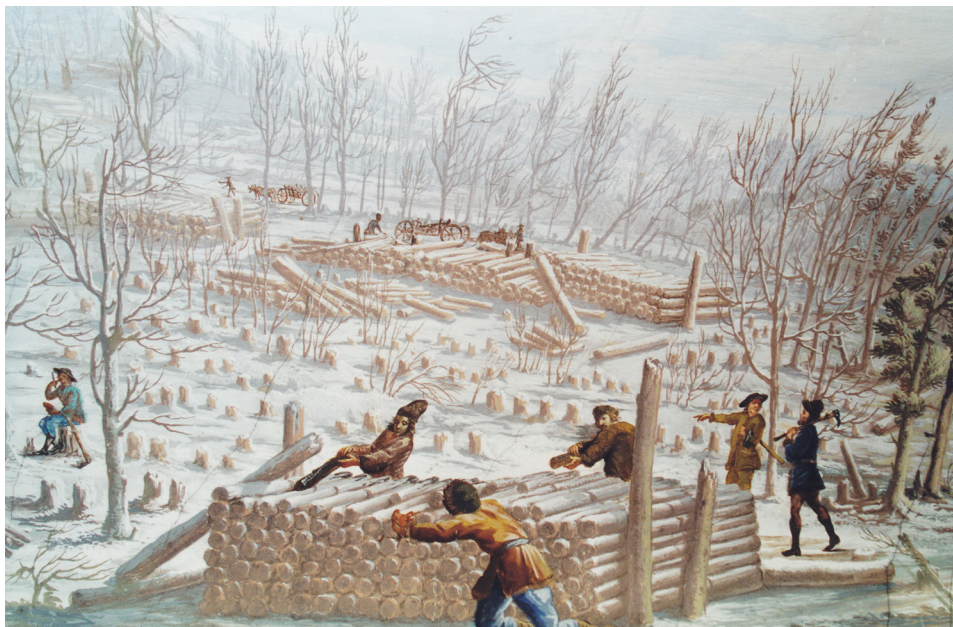
Abbildung 1: Holzarbeit von Bauern, die im Winter Robotdienst verrichten. Detailaufnahme der Freskenszenen im Maria-Theresien-Saal in Schloss Mannersdorf, Mitte des 18. Jahrhunderts, Archiv Johann Amelin, Edmund-Adler-Galerie, Mannersdorf.

dings wurden schwere Robotbelastungen, wie sie etwa den Bauern im Gföhlerwald in Gestalt des Transports von Holz (Weinstecken) in das Weinland an der Donau zugemutet wurden und dort zu Aufruhr und „Renitenz“ der Untertanen führten, auch vom „aufgeklärten“ Regime weiterhin erzwungen, wenn der Grundherr dem etablierten Hofadel angehörte. 25