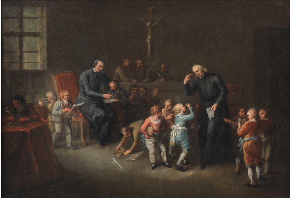
Abbildung 9: Geistliche unterrichten und prüfen mit dem Katechismus als elementarem Schulbuch der Zeit.

Unterrichtsszene in einem Institut für männliche Zöglinge, um 1750, Wien Museum, 75408, CC BY 4.0, Foto: Birgit und Peter Kainz, online: https://sammlung.wienmuseum.at/objekt/145528 (16.11.2023).