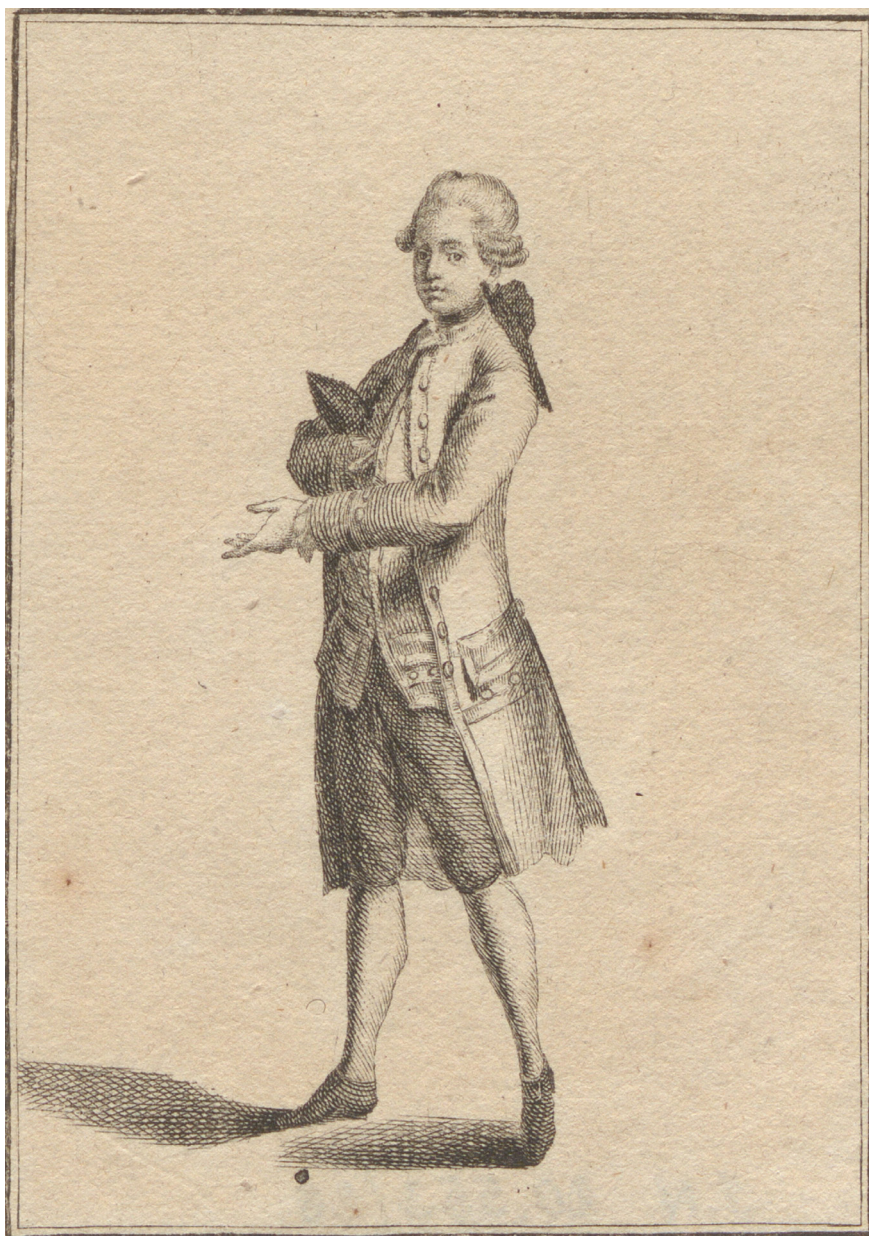
Abbildung 3: Bildnis eines Kanzlisten, der über Tinte und Feder als Zeichen der zunehmenden Verwaltung gebot.

Kanzlist. Un Commis de la Chancellerie , aus: Abbildungen des gemeinen Volkes zu Wien , Blatt 28, Kupferstich von Jakob Adam (1748–1811), 1777, Wien Museum, 20553/28, CCo, online: https://sammlung.wienmuseum.at/objekt/50539 (16.11.2023).