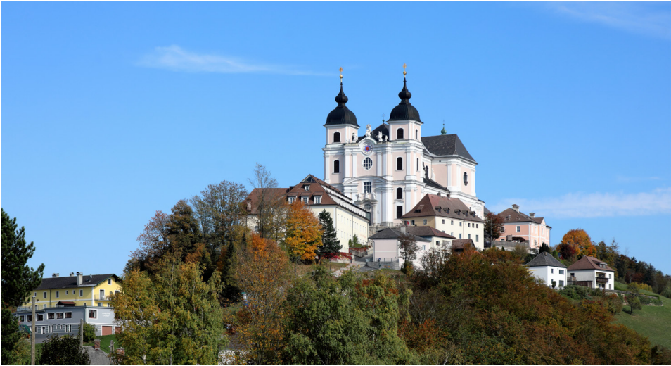
Abbildung 4: Die auf 704 Meter gelegene Wallfahrtskirche am Sonntagberg wurde unter der Patronanz des Stiftes Seitenstetten von den Baumeistern Jakob Prandtauer und Joseph Munggenast zwischen 1706 und 1732 erbaut.

Sonntagberg, Wikimedia Commons, CC-BY-SA-4.0, Foto: C.Stadler/Bwag, 2018.