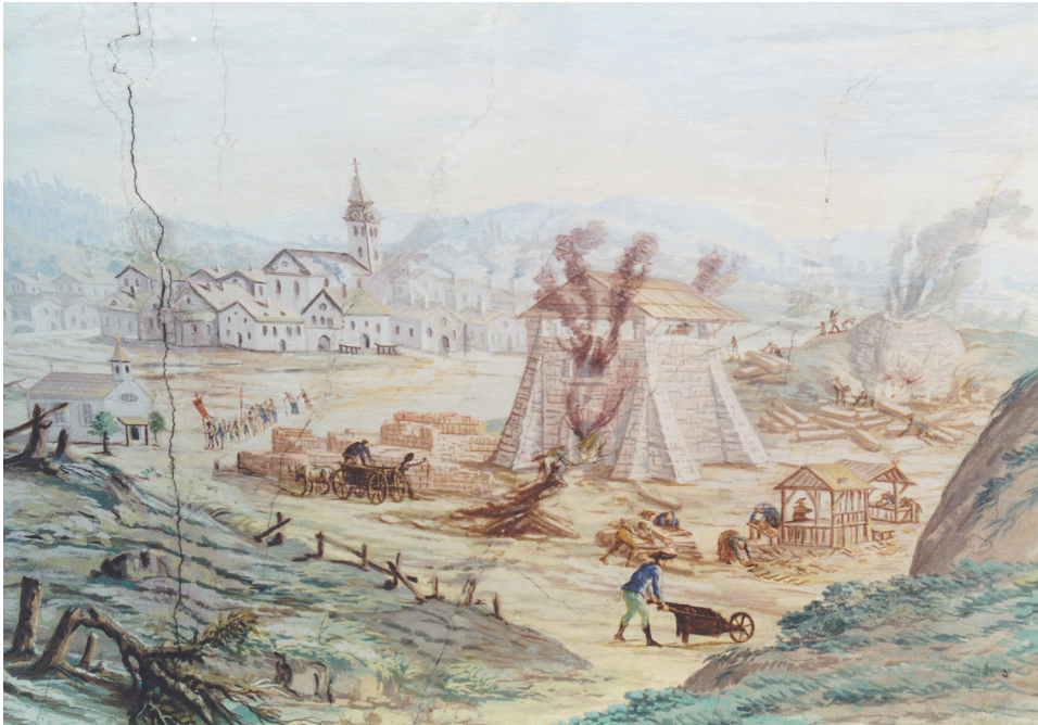
Abbildung 6: Eine Prozession von Au am Leithaberge zur Rosalienkapelle (heute abgerissen) bahnt sich ihren Weg, doch die Beschickung des Kalkofens macht vor Feiertagen nicht halt. Detailaufnahme der Freskenszenen im Maria-Theresien-Saal in Schloss Mannersdorf, Mitte des 18. Jahrhunderts

hunderts zusammenhängt), ging auch eine Veränderung im wissenschaftlichen Leben vor sich. Die Geistigkeit des 16. und 17. Jahrhunderts war stark protestantisch geprägt gewesen. Die Repräsentanten dieser Kultur wie Wolf Helmhard von Hohberg (1612–1688) 125 oder Catharina Regina von Greiffenberg (1633–1694) waren in die Emigration gedrängt worden. 126 Nun verbreitete sich eine neue katholische Kultur, die einerseits vom Hof und von den Jesuiten, andererseits von den Stiften