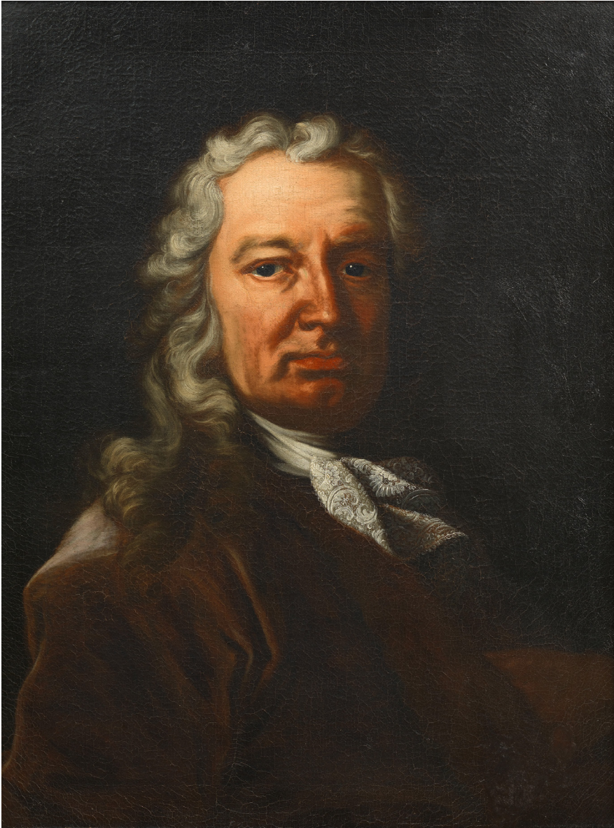
Abbildung 5: Der Barockmaler Johann Michael Rottmayr (1654–1730) war nicht nur für die Salzburger Erzbischöfe, sondern auch für Stift Melk und niederösterreichische Adelige (z. B. Freskierung im Ahnensaal der Familie Althan in Schloss Frain an der Thaya) tätig. Selbstbildnis Johann Michael Rottmayr, um 1709, Wien Museum, 12929, CC BY 4.0, online: https://sammlung.wienmuseum.at/objekt/7 (16.11.2023).