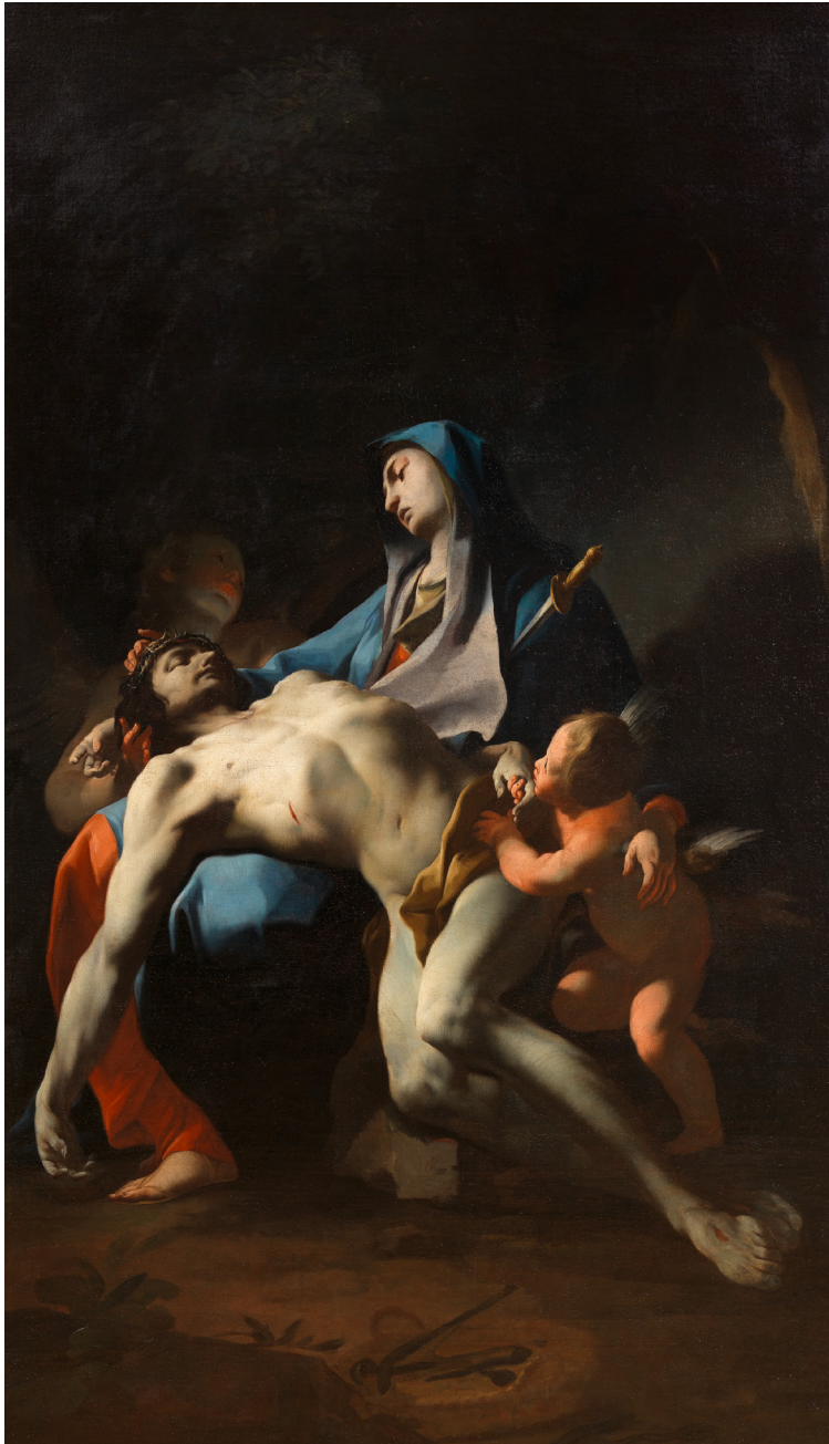
Abbildung 8: Pietàdarstellung, Paul Troger, um 1735, Wien Museum, 117341, CC BY 4.0, online: https://sammlung.wienmuseum.at/objekt/200641 (16.11.2023).