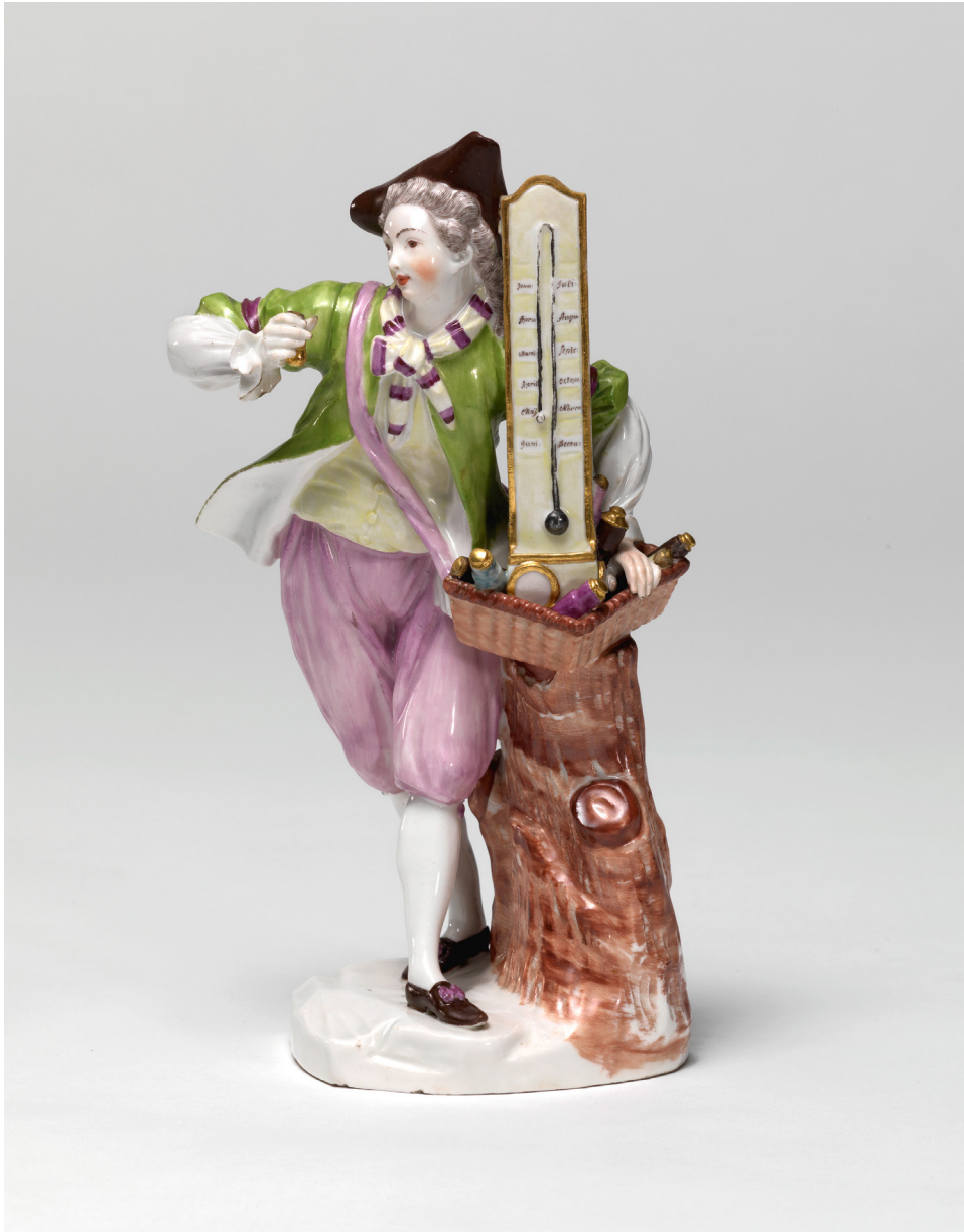
Abbildung 12: Barometerverkäufer nach Art der Wiener Kaufrufdarstellungen in Form eines Tafelschmuckes. Die Figur ist gleichzeitig auch ein Symbol der Verwissenschaftlichung der Welt im 18. Jahrhundert.

Porzellanfigur gestaltet von Dionisius Pollion, ausgeführt durch die Wiener Porzellanmanufaktur, um 1760, Wien Museum, I220899, CC BY 4.0, online: https://sammlung.wienmuseum.at/objekt/1360 (16.11.2023).