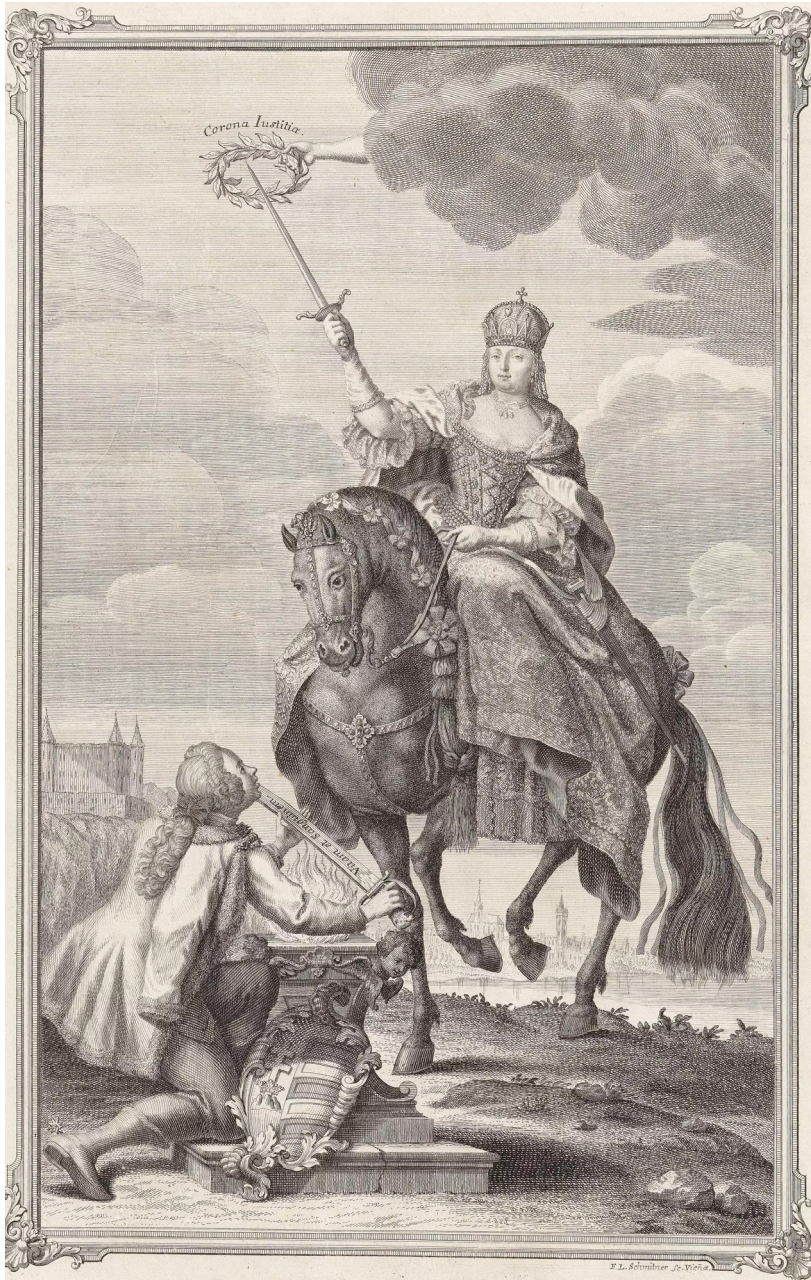
Abbildung 2: Maria Theresia mit der Stephanskrone als weibliche Regentin im Damensattel bei der Krönung zur Königin von Ungarn, Kupferstich von Franz Leopold Schmittner (1703–1761), um 1741, Wien Museum, 169850/2, CCo, online: https://sammlung.wienmuseum.at/objekt/394946 (16.11.2023).