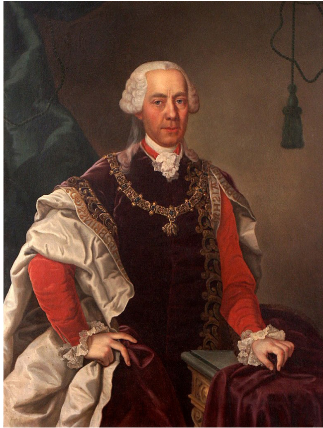
Abbildung 9: Friedrich Wilhelm von Haugwitz (1702–1765), der Kopf hinter den thesesianischen Reformen, als Ritter des Ordens vom Goldenen Vließ, Ölgemälde von Johann Michael Militz (1725–1779), 1763, Národní památkový ústav (Nationales Institut für Kulturerbe), Wikimedia Commons, Public Domain.

litärische Zwecke zeigte sich in der Folge auch in der Erstellung topographischer Landesaufnahmen (Erste Landesaufnahme 1763–1787, für Niederösterreich 1773–1781) und in einer Erfassung der Untertanen als Grundlage der Heeresergänzung (Volkszählungen ab 1754), 92 wodurch sich die Zentralbehörden aber auch Informationen für meist hochfliegende Reformabsichten in verschiedensten Bereichen verschafften. Das Steuerwesen wurde durch die Erstellung der Theresianischen Fassion (in Niederösterreich 1751) und später durch den – nur kurz gültigen, aber für die Zukunft wegweisenden – Josephinischen Kataster (in Niederösterreich 1786/87) neu aufgestellt. Durch den Ausbau der Verkehrsinfrastruktur und die bereits unter