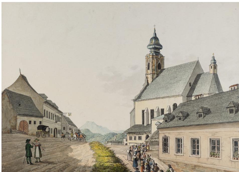
Abbildung 5: Eine Prozession von Wallfahrer*innen zieht in die Kirche von Annaberg ein, eine der großen Stationen an der via sacra nach Mariazell.

Annaberg an der Strasse nach Mariazell , kolorierte Umrissradierung von Ludwig Mohn, ca. 1810, NÖLB, Topographische Sammlung, 180.