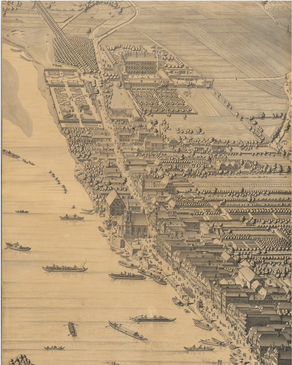
Abbildung 3: Die frühneuzeitliche Konsum- und Handelsgeschichte zeigt die überregionale Verflechtung der Händlernetzwerke. Am Beispiel der zwischen 1627 und 1775 vorliegenden Aschacher Mautregister wird der Donauhandel und seine internationale Dimension greifbar. Die Mautstelle im oberösterreichischen Aschach unterstand der auch in Niederösterreich ansässigen Familie Harrach. Der Kupferstich von Salomon Kleiner (1700–1761) aus dem Jahr 1738 stellt anlandende und abfahrende Schiffe wie Flöße in Aschach dar.

Ansicht von Aschach, Salomon Kleiner (1700–1761), Tusche, Feder, laviert, 1738, Albertina, 47482.