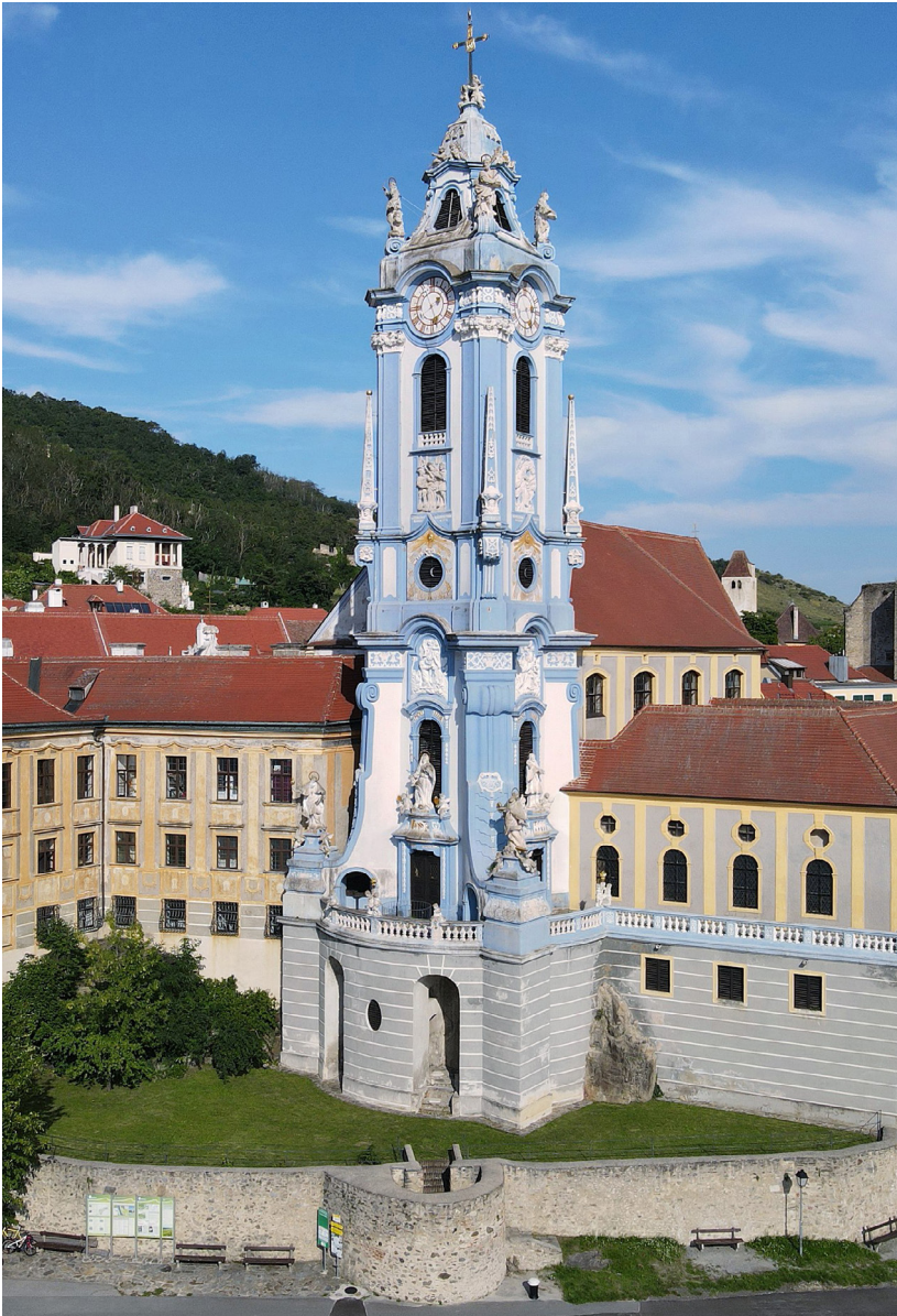
Abbildung 1: Der Turm des Augustiner-Chorherrenstiftes Dürnstein, das vom genau rechnenden Propst Hieronymus Übelbacher nach einem einheitlichen Konzept unter Verwendung vorhandener Bauteile neu gestaltet wurde. Der massive Turm ist im Kern mittelalterlich und wurde in der unteren Zone von Matthias Steinl bis 1728 und in der oberen Zone von Joseph Munggenast ausgeführt, die Figuren stammen von Johann Schmidt (1684–1761).