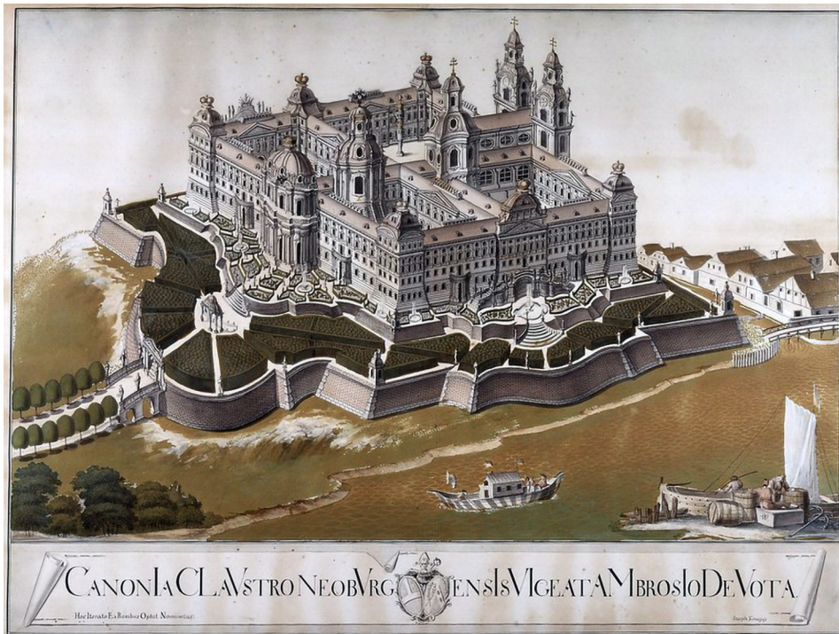
Abbildung 8: Stift Klosterneuburg, Idealansicht des barocken, nur teilweise realisierten Umbauprojektes von Donato Felice d'Allio, Aquarellierte Federzeichnung von Joseph Knapp, 1774, Wikimedia Commons, gemeinfrei.

unter Miteinbeziehung von Joseph Emanuel Fischer von Erlach (1693–1742) wurde 1730 mit der Errichtung der mehrhöfigen Kaiserresidenz begonnen; 30 zu Ende geführt wurden aber lediglich zweieinhalb Flügel des Kaiserhofes, der erst im 19. Jahrhundert vierseitig geschlossen wurde. Der lange, auf Fernsicht angelegte Südstrakt ist an seinen überkuppelten Eckrisaliten monumental mit dem Erzherzogshut bzw. mit der Kaiserkrone (jeweils aus Kupferblech) bekrönt. Diese einzigartige Lösung – obwohl nur ein Torso der ursprünglichen Planungen – zeigt sowohl die enge Verbindung von Religion und der Habsburgischen Dynastie ( Pietas Austriaca ) als auch das Bedürfnis, diese Verbindung mittels Architektur zu kommunizieren. Architektur wurde hier zum großartigen Medium der höchsten Stufe kaiserlicher Repräsentation. Der höfische Raum sollte damit intentional Wien verlassen und sich außerhalb der Stadtgrenzen ansiedeln.