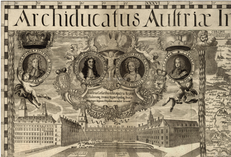
Abbildung 1: Ansicht des Burgplatzes mit der Hofburg als Machtzentrum des Landes. Vignette der Landkarte Archiducatus Austriae inferioris geographica et noviter emendata accuratissima descriptio , Jakob Hoffmann u. Jakob Hermundt (Stecher) nach Georg Matthäus Vischer, 1697, NÖLB, Kartensammlung, AV 227.

eine Vergegenwärtigung von politischen Ansprüchen oder von Herrschaftsbehauptungen mittels Medien, wie (in unserem Fall) die Architektur, einen zielführenden methodischen Leitbegriff? 2