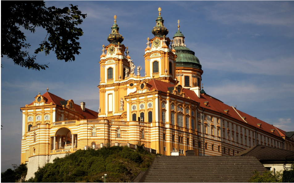
Abbildung 9: Stift Melk, imposante, zur Donau hin ausgerichtete Kirchenfassade samt Vorbauten