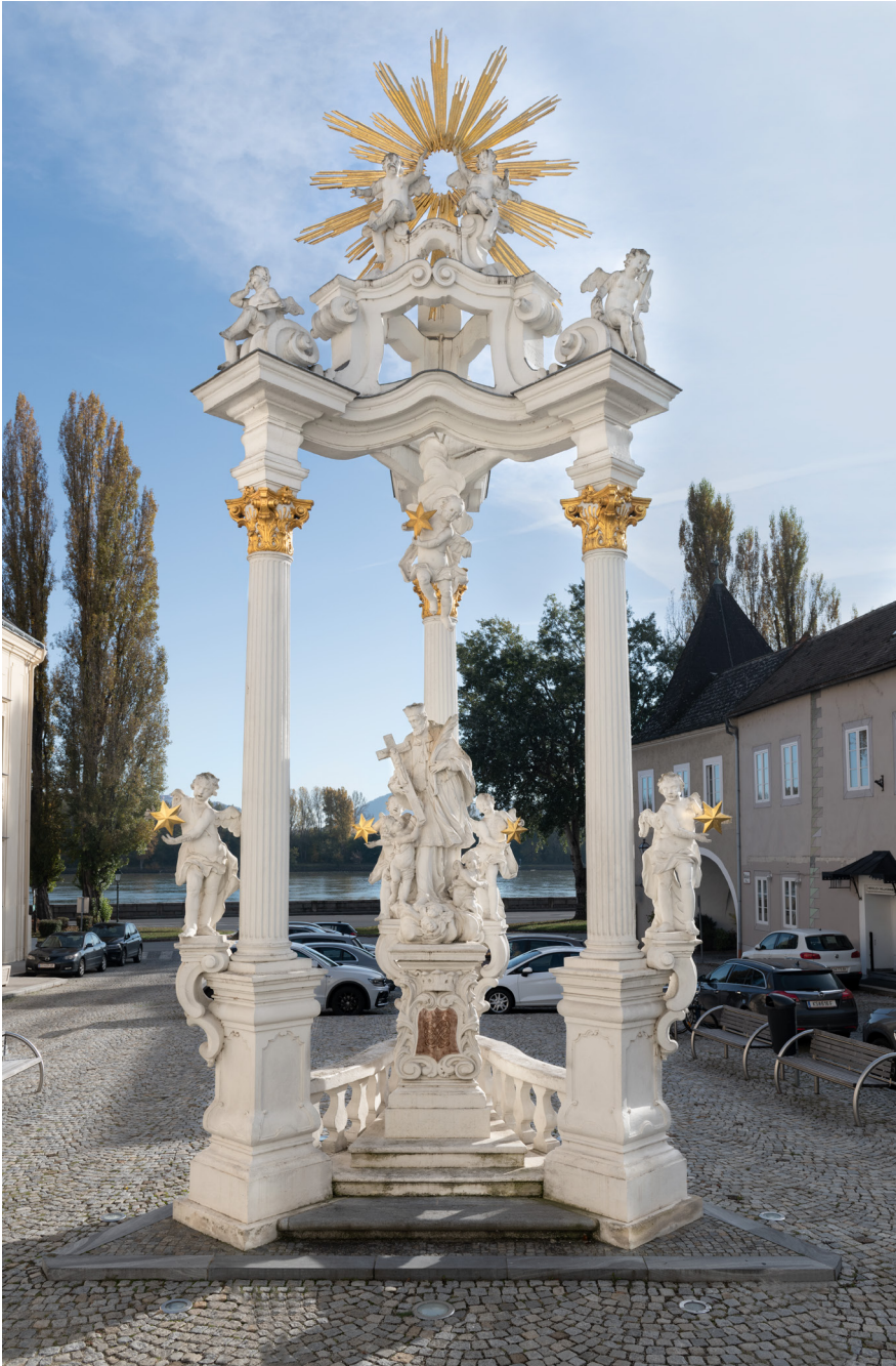
Abbildung 14: Zur Donau ausgerichtetes Figurenensemble mit Johannes Nepomuk unter dreisäuligem Baldachin, Stein an der Donau, Rathausplatz, 1715, Foto: Edgar Knaack.