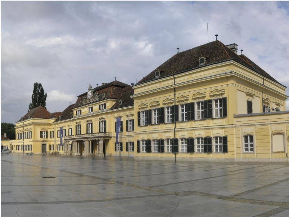
Abbildung 5: Laxenburg, Blauer Hof. Das sog. Neue Schloss wurde nach 1713 von Lucas von Hildebrandt errichtet.