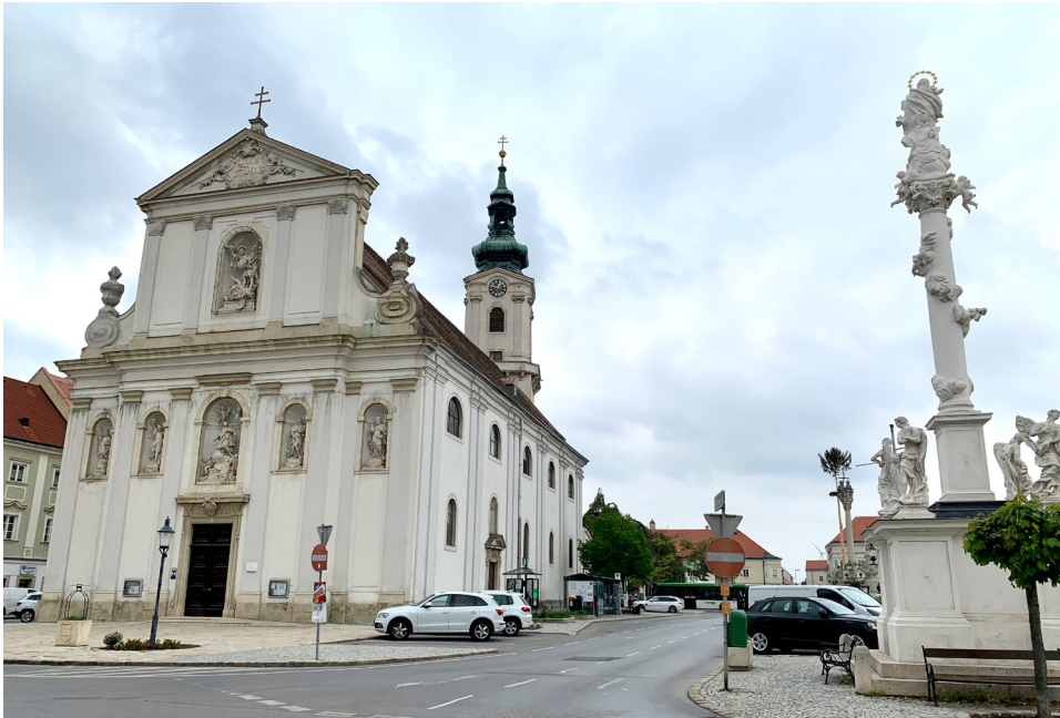
Abbildung 10: Bruck an der Leitha, Hauptplatz mit Mariensäule und südseitig ausgerichteter Fassade der Pfarrkirche

Bruck an der Leitha konnten dies auch Prälaten von Stiften sein. So thront in Wuldersdorf (Bezirk Hollabrunn) auf einem Kirchhügel über dem Marktplatz die Jakob Prandtauer zugeschriebene Pfarrkirche, deren hohe übergiebelte Fassade im 19. Jahrhundert zu einer breiten Doppelturmfassade ausgebaut wurde. 40 Ähnlich monumental ist auch die gleichfalls von Prandtauer errichtete Pfarrkirche von Ravelbach (Bezirk Hollabrunn). 41 Die Erklärung dafür findet sich in beiden Fällen im Umstand, dass es sich um Melker Stiftspfarrnen handelte und der Auftraggeber kein geringerer als der Melker Bau-Abt Berthold Dietmayr war. Sie sind damit nicht nur Ausdruck hoher Repräsentation der katholischen Kirche im Allgemeinen, sondern auch des Melker Abtes im Besonderen. Der weitgedehnte Herrschaftsbereich des Stiftes Melk erfuhr damit eine deutliche und unverkennbare architektonische Signatur. Ein Beispiel für die Selbstdarstellung durch sakrale Bauwerke im städtischen Bereich ist die Pfarrkirche „Maria Himmelfahrt“ in Waidhofen an der Thaya. Errichtet zwischen 1716 und 1723 am höchsten Punkt des zur Thaya hin abfallenden Stadtareals an Stelle eines Vorgängerbaus, verfügt sie über äußere Monumentalität und innen eine ungewöhnlich reiche Freskoeschmückung von Johann Lorenz Daysin-