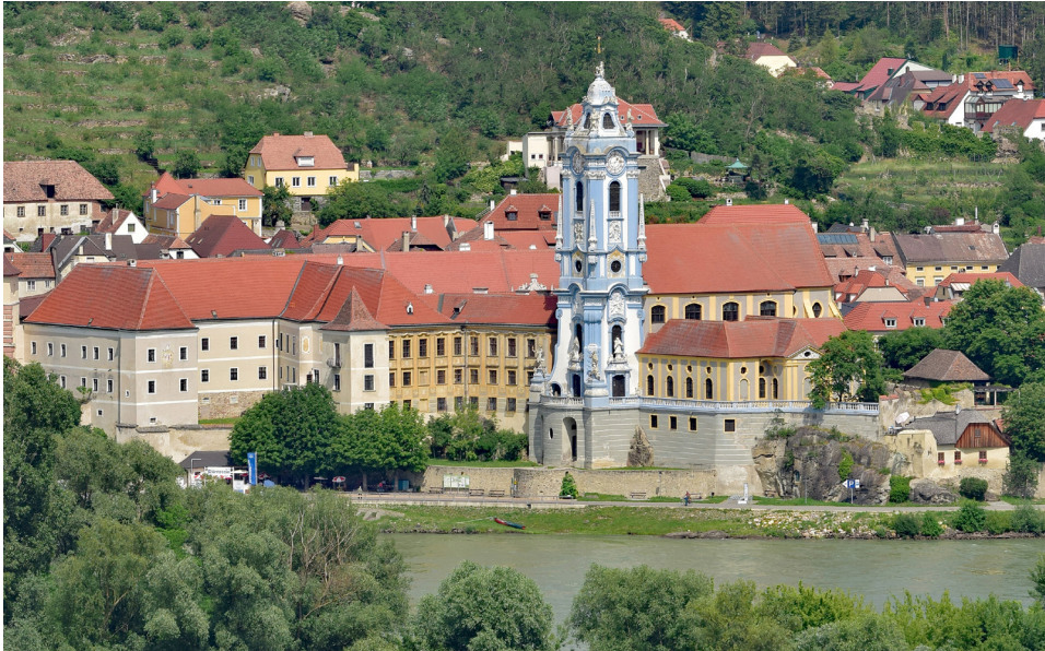
Abbildung 11: Stift Dürnstein, mit hochaufragendem, blauem Kirchenturm, gilt als Symbol der Wachau, Wikimedia Commons, CC BY-SA 4.0, Foto: Haefler, 2020.

von bemerkenswerter Qualität hinsichtlich Raumstruktur und Ausstattung. Im Ort selbst, heute von der Gleisanlage der Westbahn von der Donau getrennt, hat sich der lange Osttrakt eines ehemaligen, 1789 aufgehobenen Zisterzienserklosters mit einer barocken Fassade eines unbekanntenen Architekten erhalten.