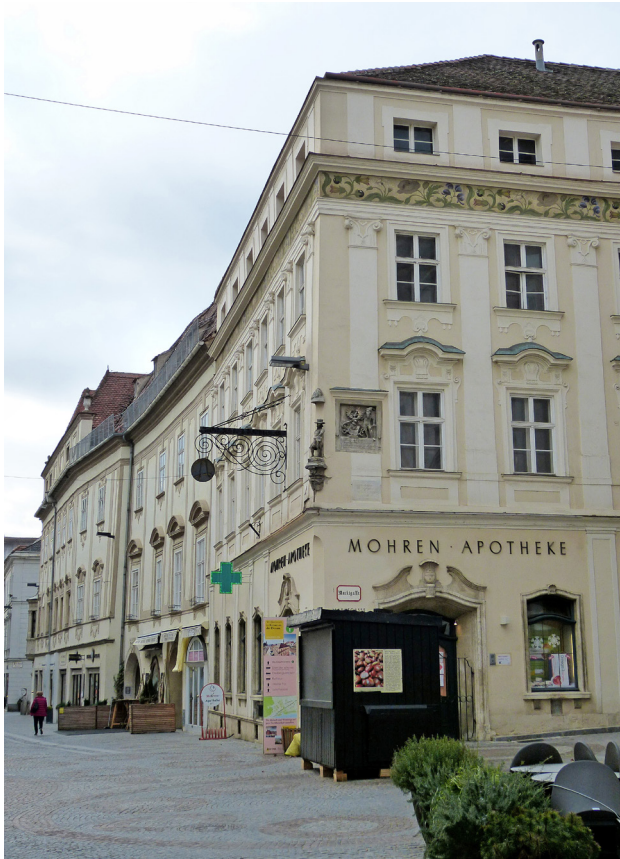
Abbildung 13: Signifikante barocke Häuserfront des 18. Jahrhunderts in Kress, Obere Landstraße Nr. 2 u. 4, Foto: Herbert Karner.

lich ihrem Wiener Vorbild auf dem Graben in der Innenstadt wurden sie alle als Dank nach Ende der Pestepidemie gestaltet: eine Wolkensäule mit Gottvater, Sohn und dem Heiligen Geist, positioniert auf unterschiedlich hohem Postament, unterschiedlich reich besetzt mit Skulpturen von Engeln und/oder Pestheiligen. Ohne Begleitung von anderen Denkmälern finden sich solche Säulen in fast inflationärer Dichte auf Plätzen in vielen größeren und kleineren Städten; hingewiesen sei hier pars pro toto auf Klosterneuburg (Stadtplatz, 1714), Mistelbach (1680), Kress (1736), Korneuburg (1745), St. Pölten (1768–82) und auf Laa an der Thaya, wo der Kirchenplatz mit einer Dreifaltigkeitssäule (bezeichnet 1710 und 1739) und der Hauptplatz mit einer Mariensäule (1680) aufgewertet ist. Der Typus der Mariensäule (Immaculata auf hoher Säule), nach Vorbild der Wiener Mariensäule am Hof gestaltet, wurde ebenfalls häufig als Pestvotiv verwendet, so etwa in Klosterneuburg (Rathausplatz, 1756/1782, gleichzeitig Erinnerungsmal an die Anerkennung der Pragmatischen Sanktion durch Frankreich 1756), Hollabrunn (1681, 1713 Ergänzung mit Figuren