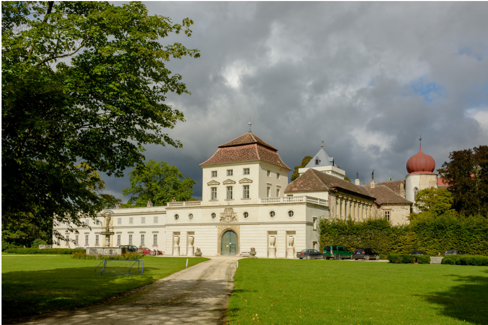
Abbildung 4: Schloss Ernstbrunn, Südseitige Hauptfassade des Vorschlosses, um 1800 klassizistisch ausgebaut.