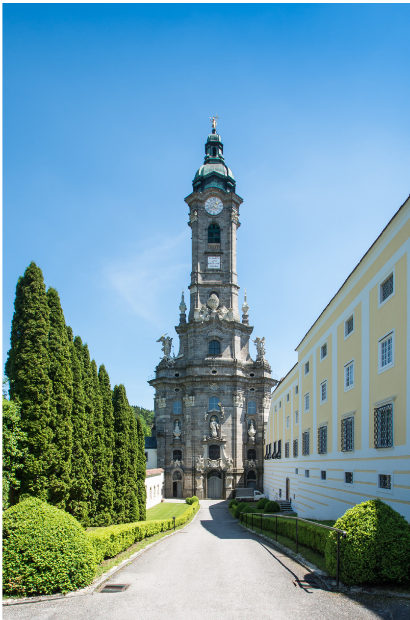
Abbildung 7: Der hochaufragende, steinsichtige Turm des Stiftes Zwettl kann als ein Wahrzeichen des Waldviertels gelten.

Stift Zwettl, Turm der Kirche, Wikimedia Commons, CC BY-SA 3.0 at, Foto: Flashcube99, 2014.