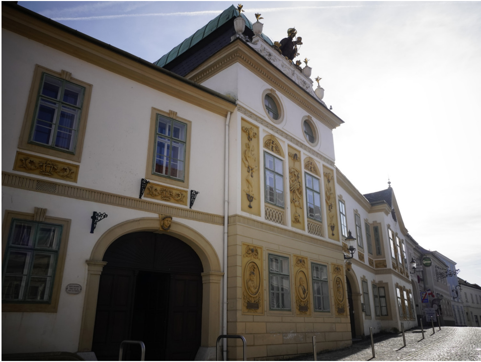
Abbildung 6: Die Alte Post in Melk wurde Ende des 18. Jahrhunderts mit palastartiger Fassade errichtet, Foto: Daniel Butter.

ließ er spektakuläre Poststationen in Luberegg (heute das sogenannte „Schloss“, ursprünglich für die Verwaltung des Holzhandels) und vor allem in Melk (siehe Abbildung 6) und Purkersdorf von Franz Wipplinger erbauen. Für die beiden letztgenannten bediente er sich einer neuen, klassizierenden, mit großen figuralen Reliefs versehenen Formensprache.