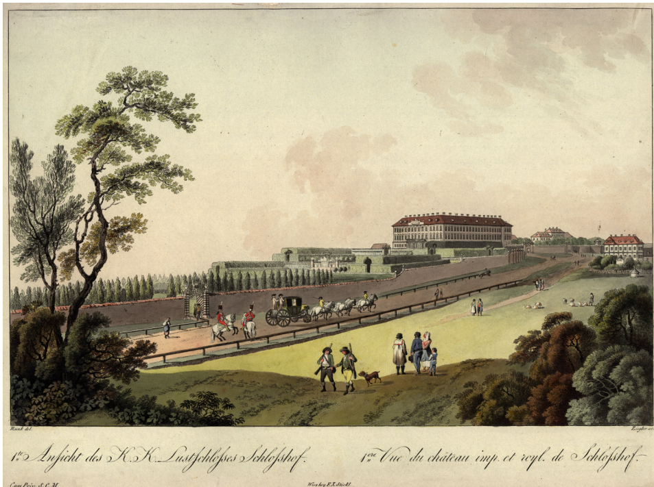
Abbildung 3: Schlosshof, ehemaliges, von Lucas von Hildebrandt zu einer großen Schlossanlage ausgebauten Kastell.

Ansicht des K.K. Lustschlosses Schlosshof , Ferdinand Runk (Zeichner), Johann Ziegler (Stecher), kolorierte Umrissradierung, 1795, NÖLB, Topographische Sammlung, 6644.