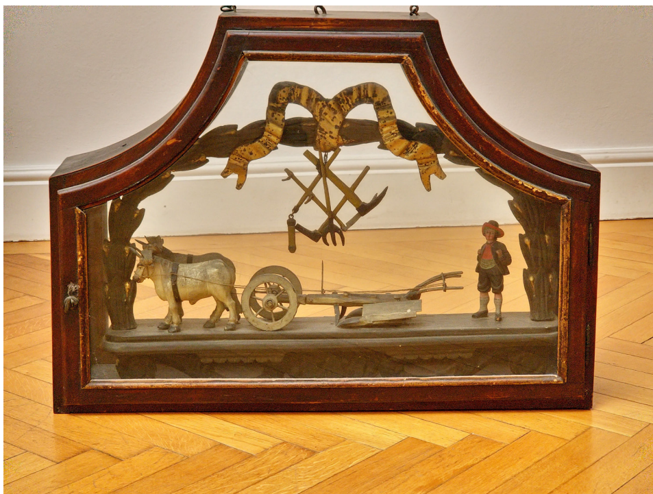
Abbildung 2: Ein Stammtischzeichen, das üblicherweise im Gasthaus das Vorrecht einer Gruppe auf einen bestimmten Tisch signalisiert, bringt Zugehörigkeit und in diesem Fall auch Status zum Ausdruck. Die Herkunft dieses Objekts ließ sich nicht genauer klären. Die dargestellten Geräte – Leitenpflug, Ochsengespann, Sappie und Holzspalthacke – lässt auf Waldwirtschaft als Kontext und damit auf Waldbauern schließen.

Stammtischzeichen der Bauern (um 1800), FA Salzer.