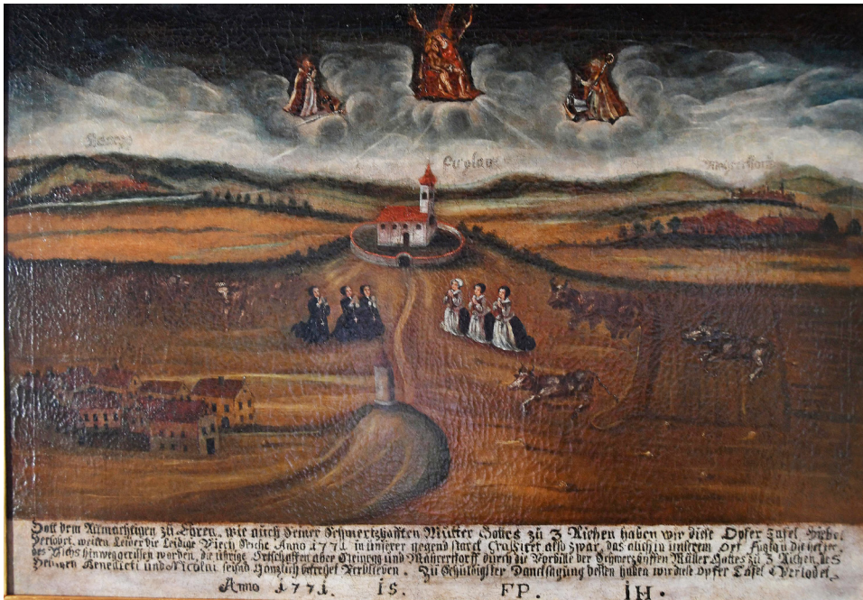
Abbildung 3: Votivtafeln, die zum Dank für überstandenes Unheil gestiftet wurden, sind Ausdruck eines Verständnisses, dass existenzielle Gefährdungssituationen durch die erflachte Fürsprache von Heiligen abgewendet werden können. Der bäuerliche Alltag war aufgrund von Tierseuchen, Pflanzenkrankheiten, katastrophalen Naturereignissen und generell der Abhängigkeit von Wetterverhältnissen besonders stark von Unwägbarkeiten geprägt.

Fuglauer Votivtafel anlässlich einer Viehseuche im Jahr 1771, Heimatmuseum Langenlois, Nr. 1255.