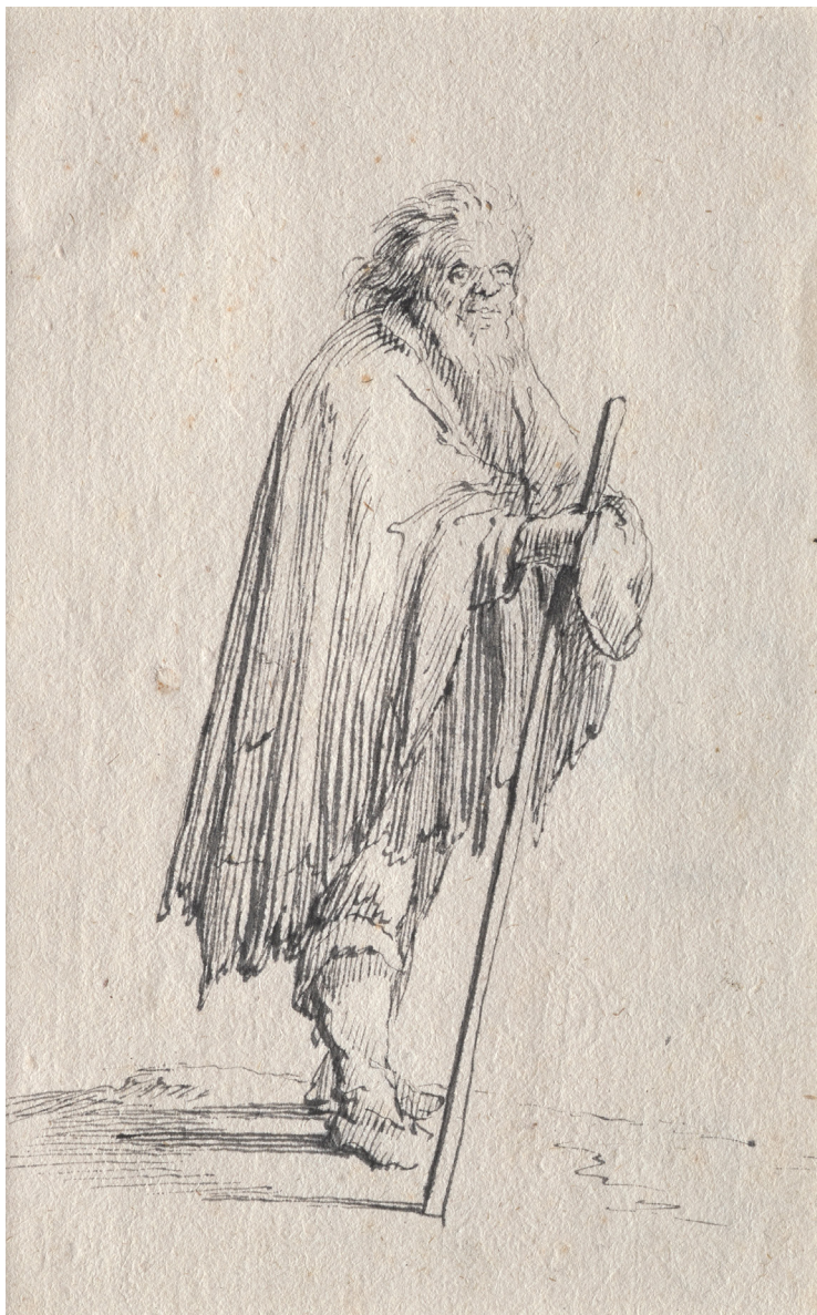
Abbildung 4: Stark unter den Bettlerinnen und Bettlern repräsentiert waren ältere Menschen, ebenso Personen mit körperlichen oder geistigen Gebrechen. Oft waren sie bei ihren Wanderungen abseits der Hauptverkehrsrouten unterwegs und mieden auch Städte und Märkte, da hier die Gefahr der obrigkeitlichen Verfolgung besonders groß war. Bettler, Federzeichnung von Martin Johann Schmidt (gen. Kremser Schmidt), 1753, Belvedere, 8704.