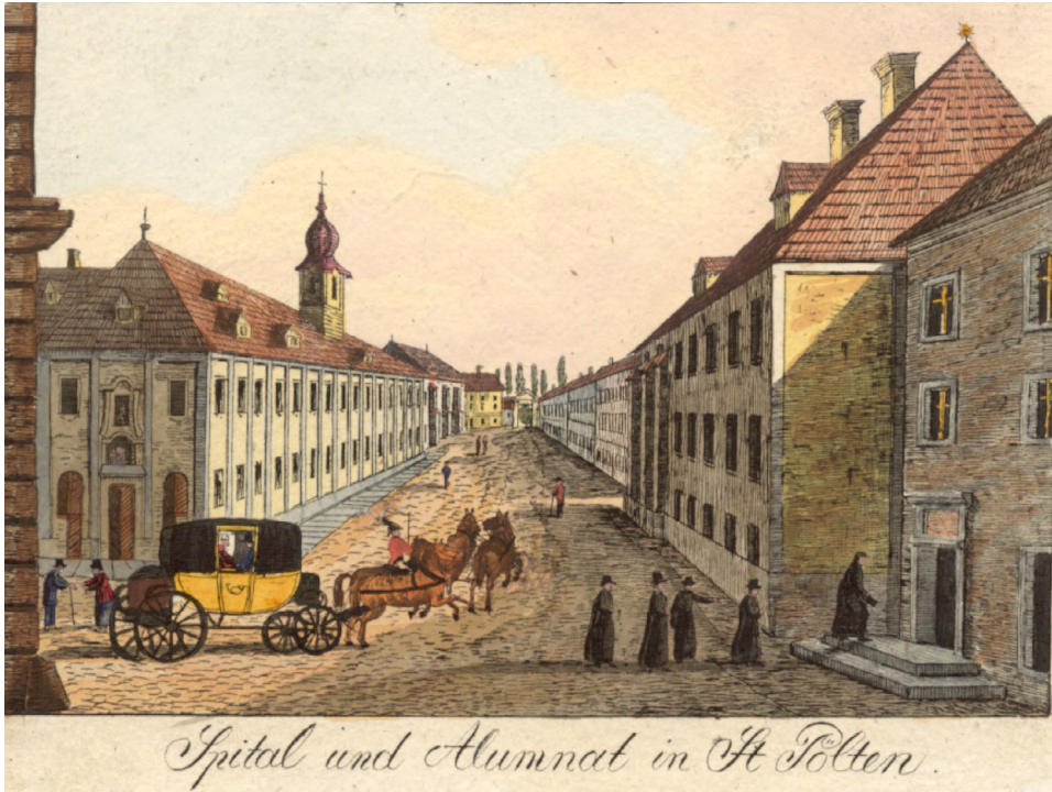
Abbildung 7: Anfang des 18. Jahrhunderts sollte das Bürgerspital St. Pölten, das 1539 neu errichtet worden war, 16 Personen versorgen, die wöchentlich einen Anspruch auf zwölf Pfund Brot besaßen. Insassinnen und Insassen durften von den vier Vierteln der Stadt entsendet werden. Bürgerspital und Alumnat in St. Pölten, kolorierte Lithographie, 1828, NÖLB, Topographische Sammlung, 6.044.

In ihrer Multifunktionalität konnten Spitäler lokal ganz unterschiedliche Ausprägungen und Zusammensetzungen aufweisen und verschiedene Leistungen anbieten. Gemeinsam war ihnen freilich, dass sie den Bedarf an Versorgungsplätzen niemals zu decken vermochten, eine strenge Reglementierung ihrer Pfründnerinnen und Pfründner einforderten und nur über eine ausgesprochen karge und einfache Ausstattung verfügten. Typisch für eine kleine Anstalt präsentierte sich etwa das Herrschaftsspital von Weitersfeld im Waldviertel. Seine Einrichtung bestand Ende des 17. Jahrhunderts aus drei Tischen und sechs Bänken, mehrere Insassinnen mussten