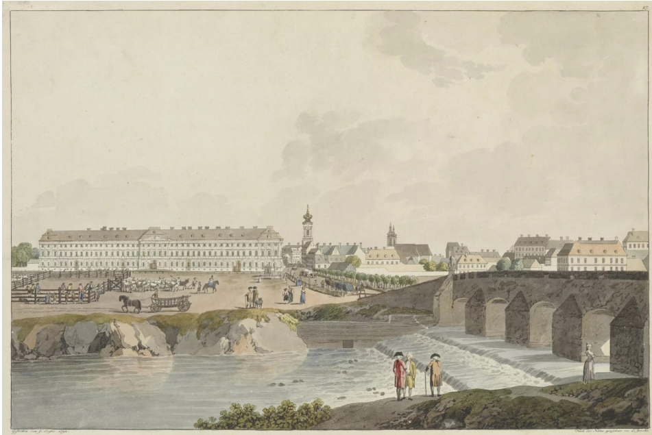
Abbildung 3: 1783 beschloss Joseph II. die Errichtung einer neuen Versorgungsanstalt für Militärinvaliden. Zu diesem Zweck wurde das bisherige Armenhaus umgebaut und erweitert und schließlich 1787 als neues Invalidenhaus eröffnet.

Ansicht des neuen Invalidenhauses am Anfang der Landstraße, Johann Andreas Ziegler, 1792, Kupferstich, koloriert, Wien Museum, 15308, CCo, online: https://sammlung.wienmuseum.at/objekt/86739 (14.5.2023).