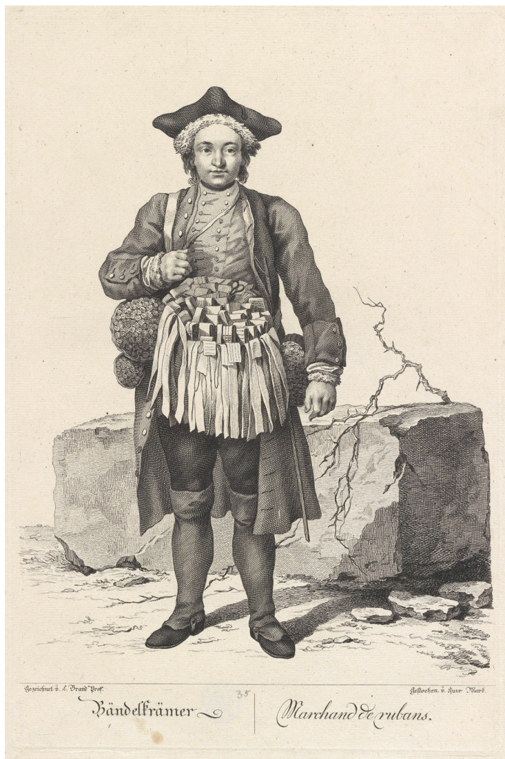
Abbildung 5: Das Hausierwesen erfuhr erst unter Maria Theresia etappenweise gesetzliche Erleichterungen, bis schließlich das Hausierpatent Josephs II. vom 1. September 1785 allen Inländern den Warenhandel in den Dörfern und Märkten erlaubte. Trotzdem herrschte seitens der Behörden großes Misstrauen gegenüber solchen mobilen Kleinhändlern, denen alle Arten von unerlaubten Nebenverdiensten unterstellt wurden.