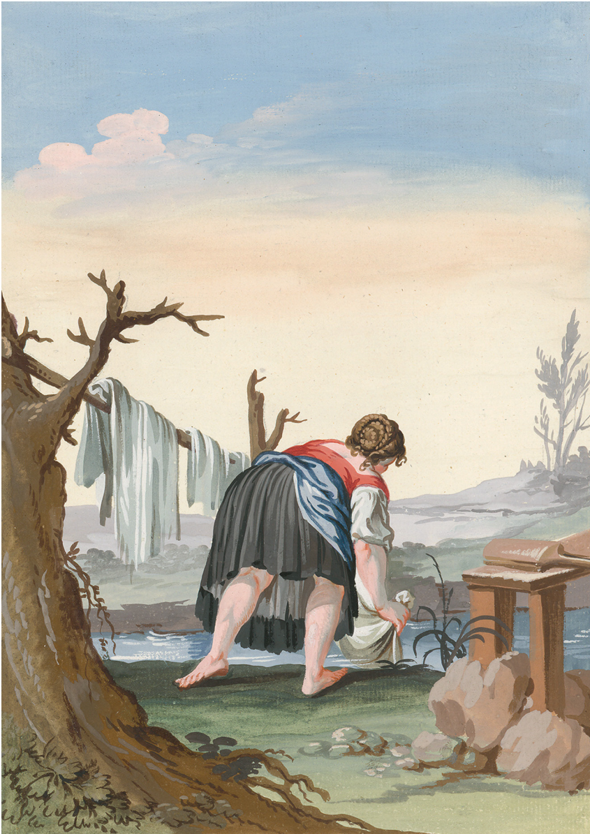
Abbildung 1: Die Arbeitsleistung der ländlichen Dienstmädchen und Dienstmänner war nicht genau definiert und reichte – Sonn- und Feiertage ausgenommen – von Sonnenauf- bis Sonnenuntergang. Mägde hatten neben ihren Tätigkeiten am Feld und im Stall auch alle anfallenden Arbeiten in der Hauswirtschaft zu übernehmen. Aufwendig und kräfteverzehrend war etwa das Waschen.

Magd bei der Arbeit, aus: Johann Felix KNAFFL, Versuch einer Statistik vom kameralistischen Bezirke Fohnsdorf im Judenburg Kreise, 1813, StLA, HS 580.