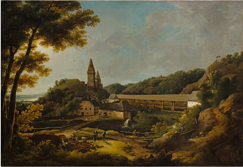
Abbildung 2: Um das getriftete Holz aufzufangen, baute man Rechen quer über die Flüsse und Bäche. Anschließend wurde eine Sortierung von Scheitern und Blochholz vorgenommen, was einen Erwerb für viele Tagelöhnerinnen und Tagelöhner darstellte.

Der Holzrechen bei der Burg Weitenegg, um 1796, Lorenz Adolf Schönberger, Öl auf Leinwand, Landessammlungen Niederösterreich, KS-27705.