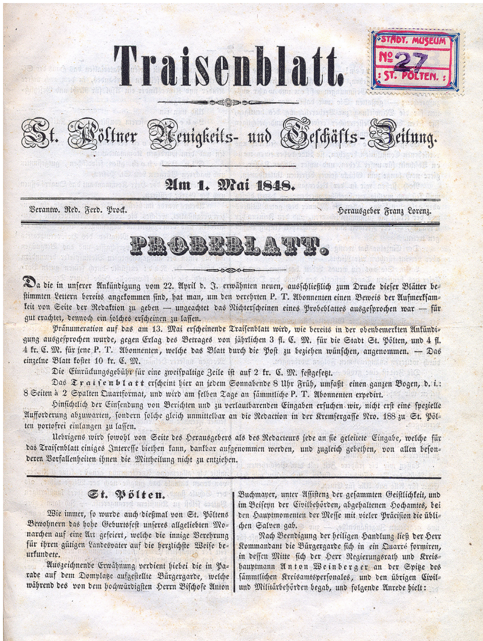
Abbildung 2: Titelseite des Traisenblatts , einer der beiden 1848 erschienenen ersten Lokalzeitungen Niederösterreichs, Stadtarchiv St. Pölten.