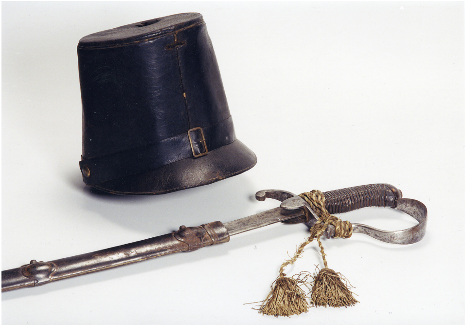
Abbildung 3: Tschako und Säbel eines Gardisten der Zwettler Nationalgarde, Stadtmuseum Zwettl, Foto: Werner Fröhlich.

bäuerlichen Renitenz hingegen näher stehen, als den Behörden lieb war; oft soll illegale Jagd mit den Gewehren der Nationalgarde stattgefunden haben. 95