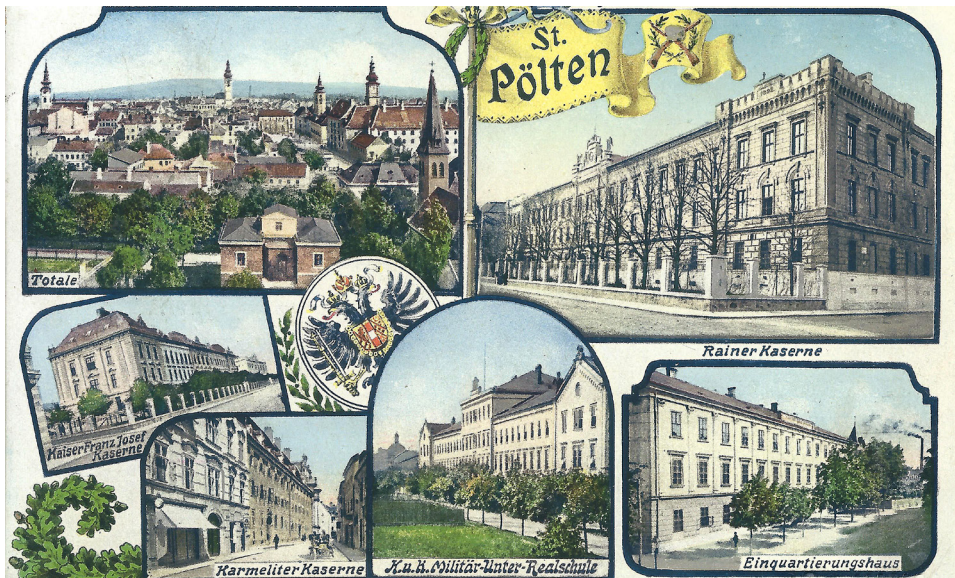
Abbildung 6: Diese Mehrbildkarte dokumentiert die jahrzehntelange Kasernenbautätigkeit in St. Pölten sehr anschaulich. Sie zeigt alle Neubauten, aber auch die Karmeliterkaserne, eine der typischen Klosterkasernen des Landes. Diese Art von Postkarten war bei den Soldaten sehr beliebt, weil man damit die Lebensumstände durch Ansichten der Kaserne darstellen konnte. St. Pölten, Postkarte, 1914/15, Sammlung Willibald Rosner.

der Stärke von zwei Regimentern. 177 Ab den 1870er Jahren kam es daher verstärkt zu Neubauten.