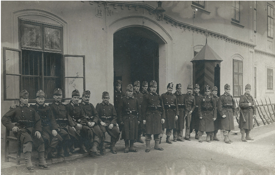
Abbildung 2: Wache und Bereitschaft waren 24-Stundendienste, die im „Radl“ von den in der Kaserne untergebrachten Einheiten zu leisten waren. Sie waren nicht sehr beliebt, weil sie einerseits langweilig waren, andererseits aber die Gefahr bargen, in den Blick inspizierender Vorgesetzter zu geraten. Diese um 1908/09 entstandene Fotografie zeigt Angehörige des niederösterreichischen Infanterieregiments Nr. 84. Solche Aufnahmen verschickte man an seine Familie, an Freunde und Freundinnen, um zu zeigen, dass es einem gut ging.

Wache und Bereitschaft am Tor 4 der Kremser Kaserne, Fotografie, 1908/09, Sammlung Willibald Rosner.