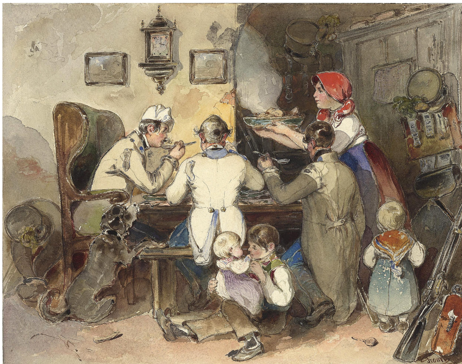
Abbildung 4: Dargestellt ist eine sehr charakteristische Szene, die deutlich zeigt, in welchem Ausmaß einquartierte Soldaten das Alltagsleben der betroffenen Hausbewohner dominierten. Neben den essenden Soldaten spielen Kinder, Tornister, Rüstung und Waffen füllen den Raum und im Hintergrund reinigt eine alte Frau den Boden.

Bei einem Bauern einquartierte österreichische Soldaten beim Mittagessen, Aquarell über Bleistift von Friedrich Treml, 1842, Österreichische Nationalbibliothek, Bildarchiv, Pk 3050, 24.