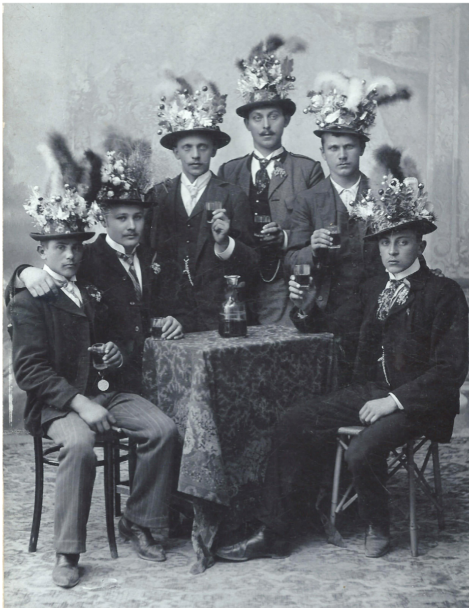
Abbildung 3: Eine Gruppe tauglich gemusterter junger Männer aus dem Viertel unter dem Wienerwald. Die Männer tragen den charakteristischen Hutschmuck, der sie als tauglich ausweist. Mit Bildern dieser Art suchte man nicht nur persönliche Erinnerungen zu bewahren, sondern auch seinem familiären und sozialen Umfeld einen Moment männlichen Stolzes, nämlich dass man „behalten“ worden war, zu demonstrieren.

Musterung, Neunkirchen, Fotografie, um 1900.