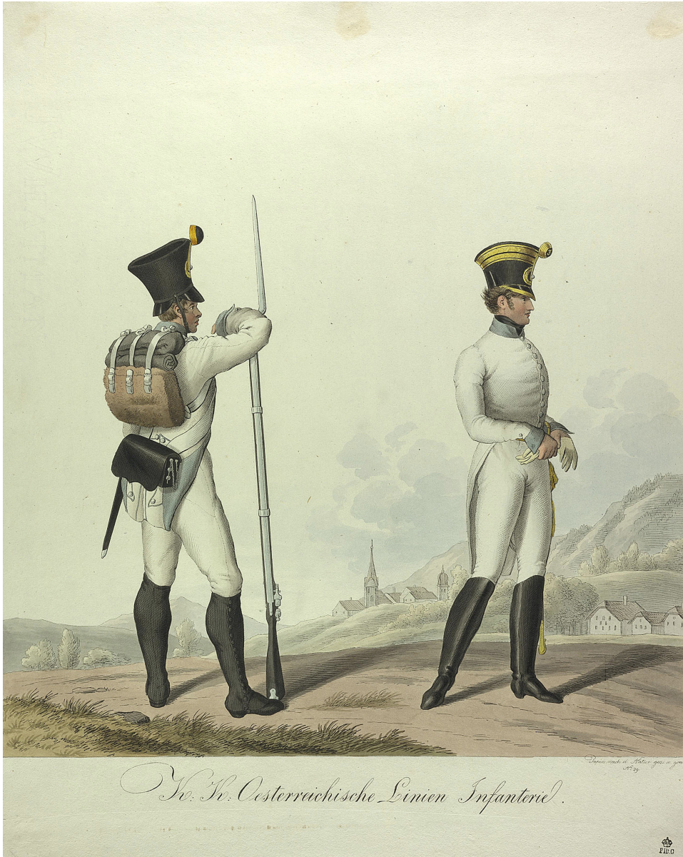
Abbildung 1: Dargestellt sind ein Offizier und ein einfacher Soldat des Infanterieregiments Nr. 49, das sich aus dem westlichen Niederösterreich ergänzte.

Offizier und Gemeiner des 49. österreichischen Linieninfanterie-Regimentes (Kerpen), handkolorierte Lithographie von Heinrich Papin aus der Serie Bildliche Darstellung der K. K. Österreichischen Armee , verlegt bei Joseph Trentsensky in Wien, um 1820, Österreichische Nationalbibliothek, Bildarchiv, Pk 453,90.